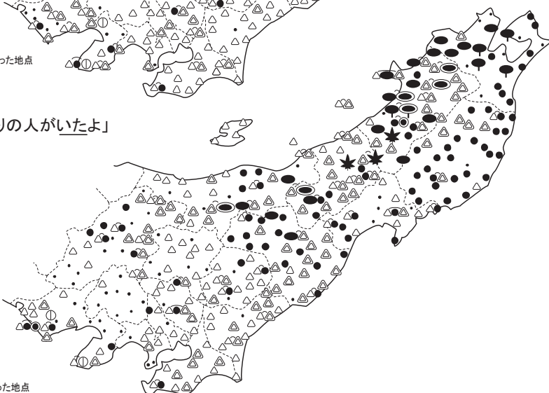
図 57 「いる」のテンス表現の分布 (東日本)

〔原図〕『方言文法全国地図』197 図「いるか」(質問文: 親しい友達の家を尋ねて、入り口で「〇〇さん、いるか」と言うとき、どのように言いますか。)、196 図「いた」(質問文: 「あの人は、さっきまで確かにここにいた」と言うとき、「ここにいた」のところをどのように言いますか。)、190 図「いたよ」(質問文: 昔、自分が子どものころに、この土地にも の知りの人が いました。その人のことを孫に教えてやります。「昔、ここにも の知りの人が ……」その次にどのように言いますか。)